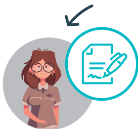
Le collaborateur ou la personne de confiance