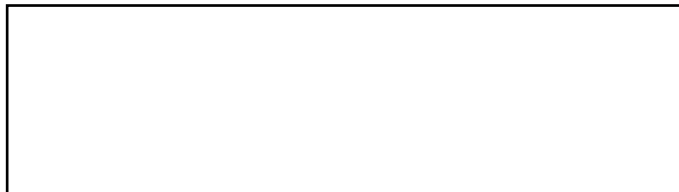
Foto van aanvrager Recent en heel gelijkend In kleur 45 X 35 mm Lichte egale achtergrond Foto moet tekst bedekken maar mag randen van kader niet bedekken

Niets boven deze lijn schrijven (behalve handtekening).