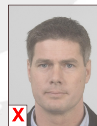
D. Onvoldoende contrast (flets)