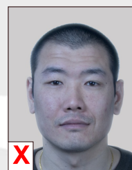
C. Onnatuurlijke weergave